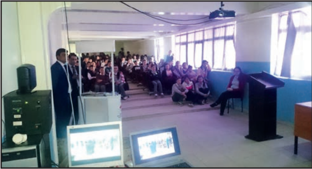
Ardahan Halitpaşa Anadolu Lisesi öğrencileri zaman yönetimi temalı konferansı ilgiyle izlediler.

Ardahan BST İl Müdürlüğü 2016 Verimlilik Haftası kapsamında 1 etkinlik gerçekleştirdi.