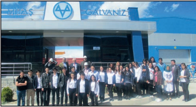
Teknik geziye katılan öğrenci ve öğretmenler toplu halde görülüyor.

25 Nisan 2016 tarihinde Balgat Aliye Yahşi Kız Teknik ve Meslek Lisesi, Ayrancı Mesleki ve Teknik Anadolu Lisesi ve Fatma Yaşar Önen Mesleki ve Teknik Anadolu Lisesi öğrenci ve öğretmenlerinden oluşan 40 kişinin katılımıyla Anadolu ve ASO 2. ve 3. Organize Sanayi Bölgelerine teknik gezi düzenlendi.