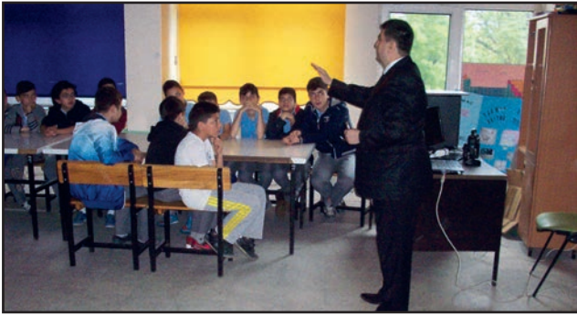
Bartın Hendekyanı Ortaokulu

25 Nisan 2016 tarihinde Hendek Yanı Ortaokulu'nda stant açılarak öğrencilere VGM tarafından gönderilen broşür ve hediye kiti dağıtıldı. Bilim, Sanayi ve Teknoloji Bakanlığı'nın verimlilik konusundaki çalışmalarının anlatıldığı sunumun ardından verimli ve etkili ders çalışma yöntemleri hakkında bir başka sunum gerçekleştirildi. Üçüncü sunumda ise Ar-Ge verimlilik ilişkisi ve ilgili kavramlar hakkında öğrenciler bilgilendirildi.