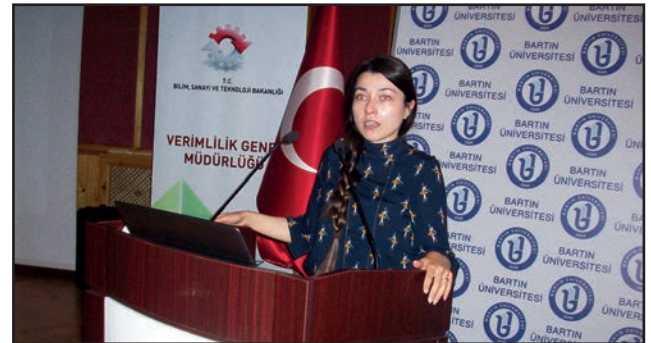
Bartın Üniversitesi'nde düzenlenen panelde verimli enerji ve verimli üretim konuları anlatıldı.