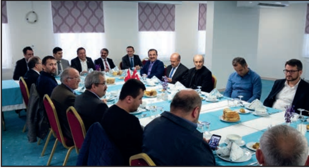
Ar-Ge ve verimlilik çalışmaları kapsamında Bartın öğretmen evinde verilen bilgilendirme toplantısı

5 Mayıs 2016 tarihinde Bartın Öğretmenevi'nde ayakkabı imalatçılarına yönelik olarak "Verimlilik, Ar-Ge, Sanayi Sicil ve Güvenli Ürün" konularında bilgilendirme yapıldı. Sektörde faaliyet gösteren işletmelerin kümelenme esasına uygun dernek ve kooperatif kurarak birlikte nasıl hareket edeceklerine dair yol haritası çizildi.