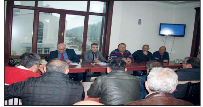
Hopa Küçük Sanayi Sitesi'nde "Elektrik Motorlarında Enerji Verimliliği" konulu bir bilgilendirme toplantısı sanayiciler tarafından ilgiyle dinlendi.