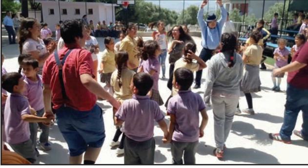
Aydın Efeler Yılmazköy İlkokulu

sırasında öğrenciler de kendilerini ifade etme imkanı buldular.