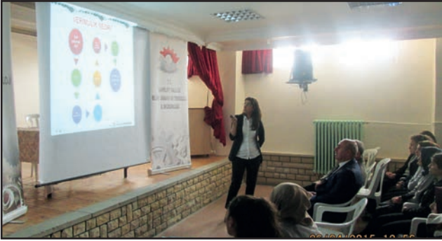
Bayburt Rekabet Anadolu Lisesi Anadolu Lisesi

Bayburt BST İl Müdürlüğü 2016 Verimlilik Haftası kapsamında 2 etkinlik düzenledi.