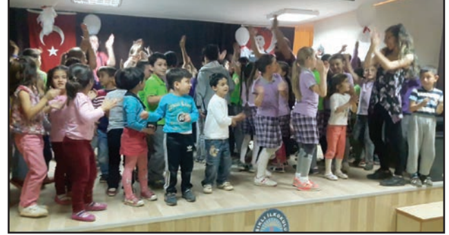
Aydın Efeler Işıklı İlkokulu

Aydın BST İl Müdürlüğü, 2016 Verimlilik Haftası kapsamında 3 etkinlik düzenledi.