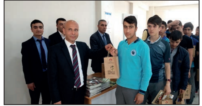
Konferansa katılan öğrencilere VGM tarafından gönderilen çeşitli hediyeler dağıtıldı.

Sunumun ardından gerçekleştirilen soru-cevap kısmında, öğrencilerin verimlilikle ilgili soruları alınarak gerekli cevaplar kendilerine verildi. Program sonunda kurulan stantlarda öğrencilere çeşitli hediyeler dağıtıldı.