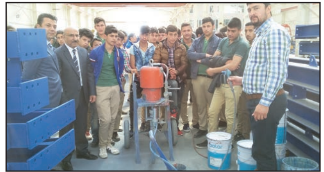
Merzifon Mesleki ve Teknik Anadolu Lisesi öğrencileri, Merzifon OSB'de faaliyet gösteren işletmeleri yerinde incelediler.