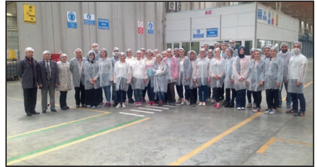
Öğrenciler, ambalaj üretim tesislerini yakından incelediler.

28 Nisan 2016 tarihinde Balıkesir Üniversitesi Endüstri Mühendisliği Bölümü öğrencilerine yönelik bir teknik gezi düzenlendi. Bu kapsamda Balıkesir'de faaliyet gösteren Sarıbekir Ambalaj firmasını ziyaret eden öğrenciler, üretim süreçlerini yerinde görme ve inceleme fırsatı buldular.