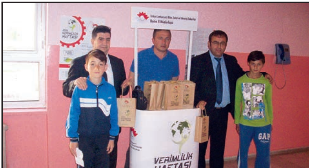
Bartın Borsa Ortaokulu

26 Nisan 2016 tarihinde Bursa Ortaokulu'nda açılan verimlilik standında VGM tarafından gönderilen broşür ve hediye kiti öğrencilere dağıtıldı. Öğrencilere verimlilikle ilgili tanıtım filmi, Bilim, Sanayi ve Teknoloji Bakanlığı'nın faaliyet alanları, Ar-Ge ve inovasyon konularında çeşitli bilgiler aktarıldı. Kamu-Üniversite-Sanayi işbirliği hakkında bilgiler verildi.