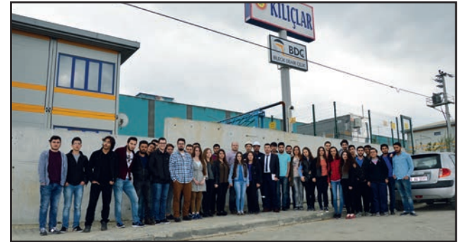
Bilecik Demir Çelik Fabrikasını gezen Bilecik Şeyh Edebali Üniversitesi Mühendislik Fakültesi Metalürji ve Malzeme Mühendisliği Bölümü öğrencileri toplu halde.