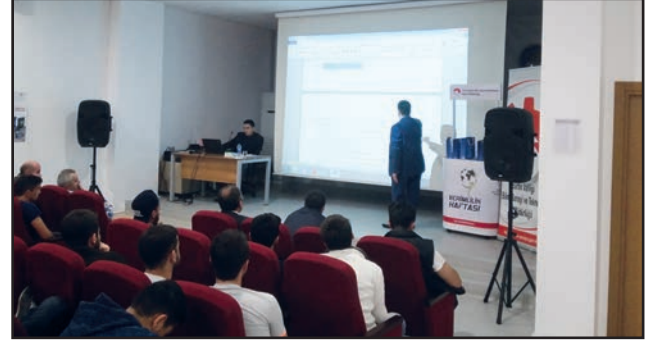
Bartın Çeşm-i Cihan Öğrenci Yurdu'nda kalan öğrencilere verimlilik ve Ar-Ge konularında sunum yapıldı.

28 Nisan 2016 tarihinde Kredi Yurtlar Kurumuna bağlı Çeşm-i Cihan Öğrenci Yurdu'nda kalan öğrencilere Bilim, Sanayi ve Teknoloji Bakanlığı'nın ülke genelinde verimlilik konusunda yaptığı çalışmalar anlatıldı. Verimli ve etkili ders çalışma yöntemleri hakkında bir sunum yapıldı. Daha sonra gerçekleştirilen sunumda ise Ar-Ge inovasyon çalışmaları, ürün güvenliği, ürünlerin teknolojik sınıflandırılması, Ar-Ge verimlilik bağlantısı gibi konular ele alındı. Açılan standta öğrencilere VGM tarafından gönderilen broşürler ve hediye kiti öğrencilere dağıtıldı.