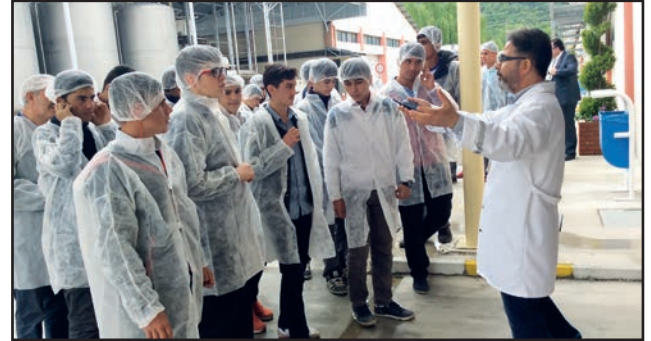
Amasya Mesleki ve Teknik Anadolu Lisesi öğrencileri Lesaffre Turquie Maya Fabrikasının üretim süreçlerini ilgiyle gözlemlediler.

uygulamalı olarak anlattılar. Kuru maya, ekmek ve un katkı maddesi imalatı yapan fabrikanın arıtma tesisi bulunuyor ve ihtiyaç duyduğu elektrik enerjisini de kendisi üretiyor.