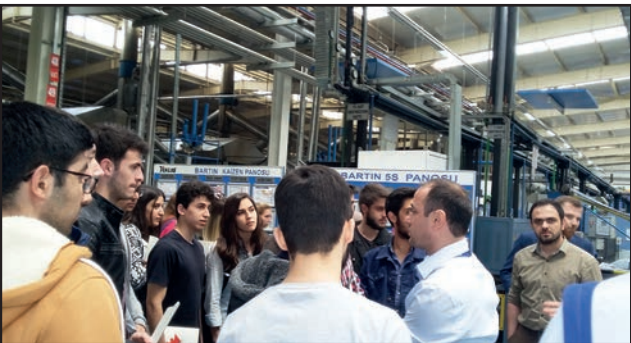
Bartın Üniversitesi Mühendislik Fakültesi öğrencileri için Teklas işletmesine teknik gezi düzenlendi.

11 Mayıs 2016 tarihinde Bartın Üniversitesi Mühendislik Fakültesi öğrencileri için Teklas işletmesine teknik gezi düzenledi. Gezi sırasında