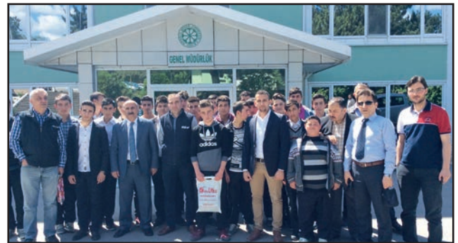
Suluova Şehit Erkan Ayas Mesleki ve Teknik Anadolu Lisesi öğrencilerinden Amasya Şeker Fabrikası tesislerini yerinde incelediler.

28 Nisan 2016 tarihinde Suluova Şehit Erkan Ayas Mesleki ve Teknik Anadolu Lisesi öğrencileri için Amasya Şeker Fabrikasına teknik gezi düzenlendi. BST İl Müdürü koordinasyonunda gerçekleştirilen