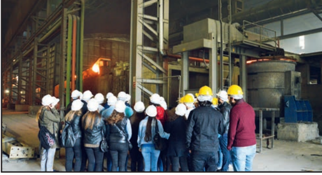
Bilecik Demir Çelik Fabrikasını gezen öğrenciler, üretim süreçlerini yerinde incelediler.

ürüne dönüştürmesinin, işletmenin verimlilik aşamasında hangi seviyede olduğunu gösterdiğini söyledi. Saray, "İşletmede modern test cihazlarında kalite kontrol testlerinin yapılması verimlilik düzeyini olumlu yönde etkileyeceğinden kalite-verimlilik ilişkisi de son derece önem arz etmektedir" diye konuştu.