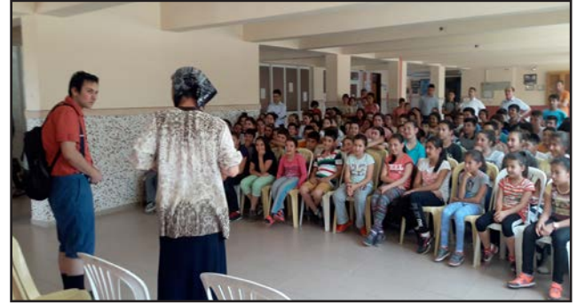
Aydın Efeler Dalama İlkokulu

Aydın BST İl Müdürlüğü, Millî Eğitim Müdürlüğü ve Efeler İlçe Müdürlüğü ile işbirliği içinde Efeler ilçesinde bulunan Işıklı, Dalama ve Yılmazköy İlkokullarında tiyatro oyunları sahnelendi. Tiyatroda üniversite öğrencilerinden oluşan amatör oyuncular rol aldı.