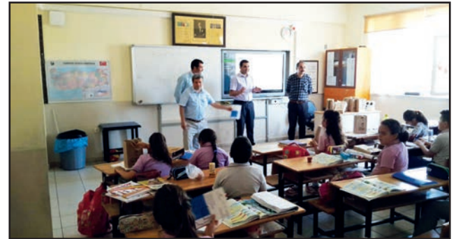
Abdurrahman-Neriman Bileydi İlköğretim Okulu öğrencilerine VGM tarafından gönderilen hediye setleri ve broşürler dağıtıldı.